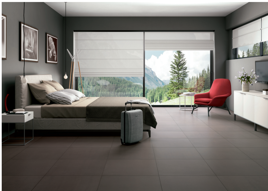
Sommers wie winters das perfekte Barfuß-Klima: Keramische Fliesen in Kombination mit einer Fußbodenheizung sind ein ideales Paar, wenn es darum geht, wohngesunde Energiespar-Wärme zu erzeugen. 010 01

Diese Textversion sowie zwei weitere Versionen können Sie im Internet herunterladen.